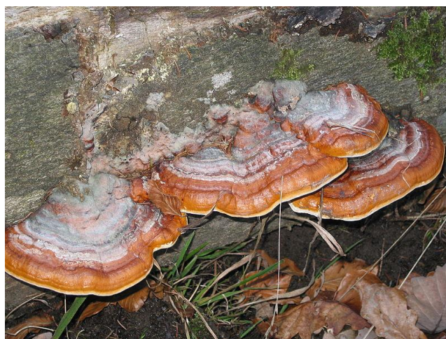
Figura 3. F. pinicola creciendo en el tronco de un árbol caído.

bacterias degradadoras de contaminantes a cierta distancia en el suelo. Algunas especies pertenecientes al género Aspergillus y Penicillium han sido investigadas para la degradación de hidrocarburos alifáticos, clorofenoles e hidrocarburos aromáticos policíclicos. También se han reportado especies de hongos con potencial para la degradación de plaguicidas como el DDT, acetocloro, glifosato, penoxsulam y tebuconazol. Entre estas especies podemos nombrar a Fusarium sp. , Aspergillus flavus , Aspergillus niger , Fomitopsis pinicola (Figura 3), Tolyptocladium geodes , Cordyceps sp. , entre otros.