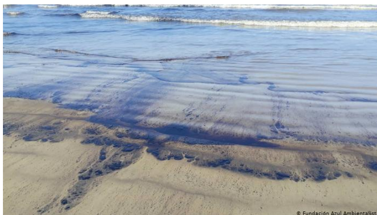
Figura 1. Derrame de petróleo desde la refinería El Palito del municipio Puerto Cabello en Carabobo, Venezuela ocurrido en el año 2020.

Las técnicas de biorremediación ambiental son empleadas desde hace varios años. Como ejemplo tenemos su aplicación en el área petrolera y petroquímica para la limpieza de derrames de petróleo en suelos y zonas costeras. Cuando los hidrocarburos llegan a las costas, algunas bacterias pertenecientes a las comunidades microbianas nativas logran sobrevivir al desarrollar la capacidad de degradar una parte de esta sustancia.